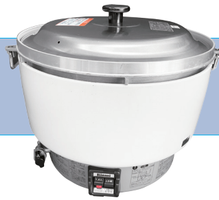
ガス炊飯器(5.5升炊き) サイズ/W600×H450 H480 ㉟ ガス使用量/0.73kg/h 要乾電池 5,500円/1日