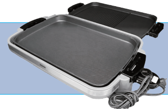
ホットプレート サイズ/W600×H38 ㉟ D110 ㉟ 電源/1350W 2,500円/1日