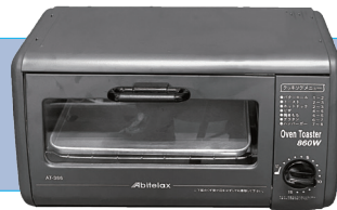
オーブントースター サイズ/W314×D215 H237 ㉟ 電源/850w 1,000円/1日