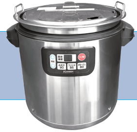
スープジャー(1.8ℓ) サイズ/W460×H405 D400 ㉟ 電源/280W 5,500円/1日