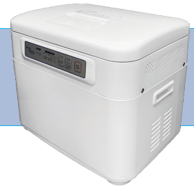
電気餅つき機(2升炊き) サイズ/H345×W415 D315 ㉟ 電源/795w 3,500円/1日