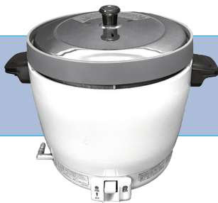
ガス炊飯器(2升炊き) サイズ/W430×H350 D330 ㉟ ガス使用量/0.33kg/h 要乾電池 3,000円/1日