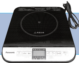
IH調理機 サイズ/W304×H54 D345 ㉟ 電源/1400W 2,500円/1日