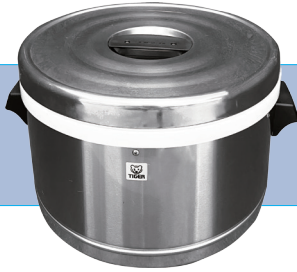
保温ジャー2升2合(3.9L) サイズ/W430×H250 D360 ㉟ 電源:不要 2,500円/1日