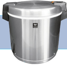
電子ジャー5升(9L) サイズ/W481×H408 D395 ㉟ 電源/48W 5,500円/1日